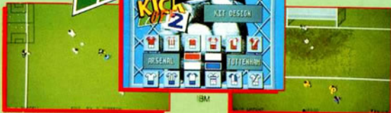
Expanded Amiga version